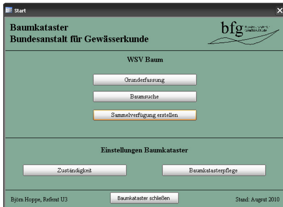
Abbildung 1: Startformular „Baumkataster“